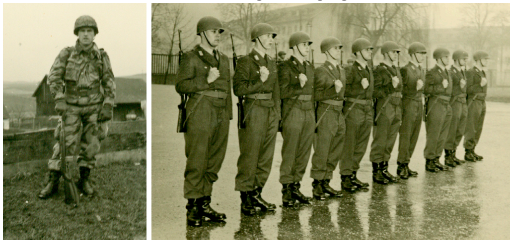
Ein Blick ins Familienalbum:

Charmanter kann man es nicht formulieren. Ein Argument fehlt jedoch: Familientradition. Frühkindliche Beeinflussung und Prägung.