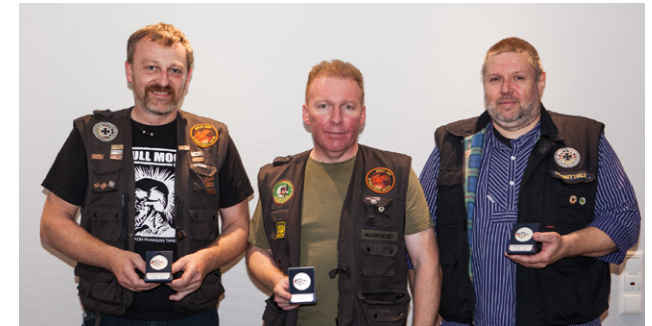
Links und rechts außen: Die siegreichen Mannschaften